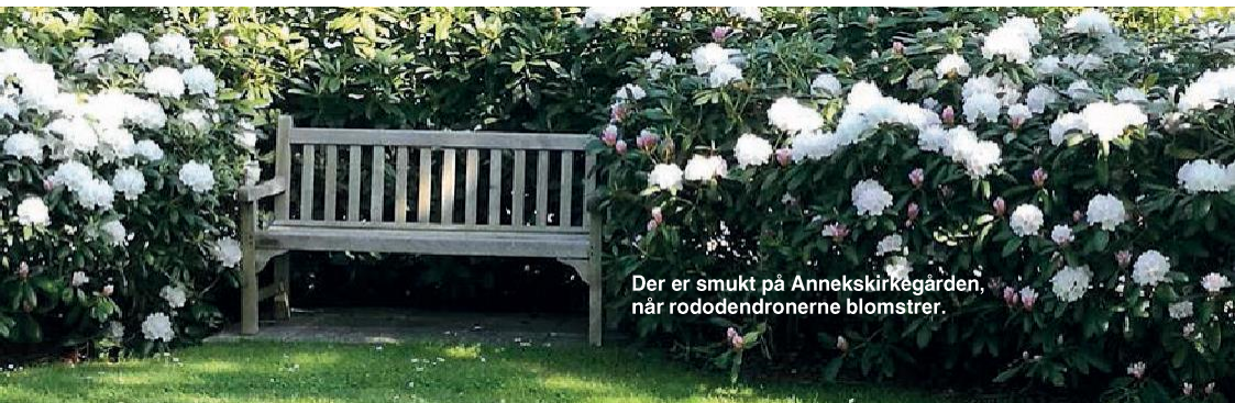
Der er smukt på Annekskirkegården, når rododendronerne blomstrer.

Præstegårdsudvalget har ansvaret for at vedligeholde de to præsteboliger og for reparationer og nyanskaffelser af diverse tilbehør. Arbejdet foregår naturligvis i tæt samarbejde med præsterne, der bor i præsteboligerne.